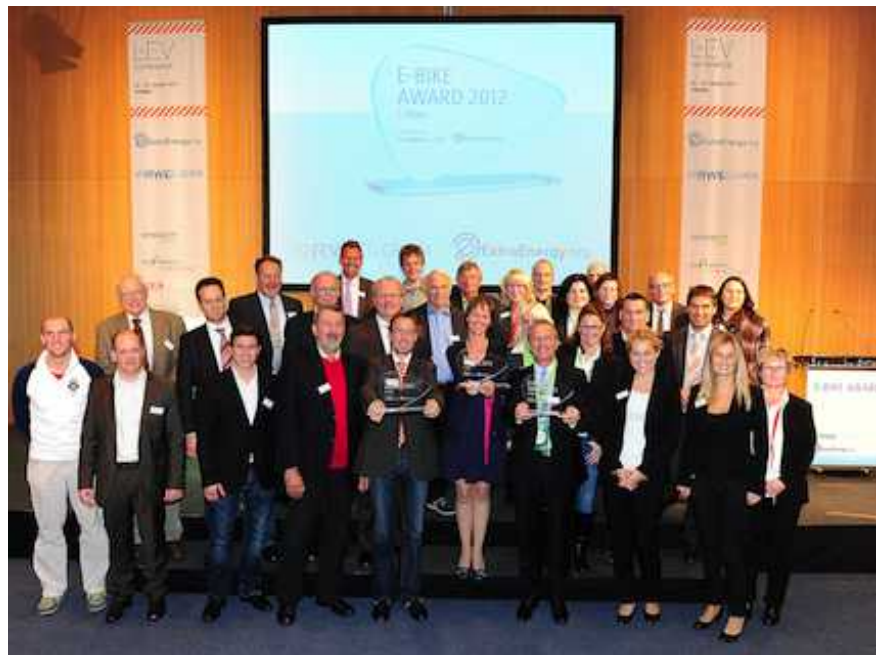
E-Bike Award Zeremonie 2012, Gruppenbild aller Beteiligten, Foto: RWE Deutschland AG

Passend zum Schwerpunktthema fand in diesem Jahr die Verleihung des E-Bike Awards 2012 auf der LEV Conference statt. Der E-Bike Award ist ein von ExtraEnergy e.V. und der RWE Deutschland AG initiiertes Projekt, das von der Internationalen Energieagentur (IEA) und dem EU-Programm "Intelligent Energy Europe" (IEE) unterstützt wird. Der E-Bike Award zeichnet E-Bike- / Pedelec-Projekte mit besonders hohem Innovationsgrad, großem Nutzen für die Öffentlichkeit und nachhaltiger Wirkung aus. Städte, Gemeinden, Tourismusverbände und andere öffentliche Einrichtungen konnten sich um den mit insgesamt 8.000 Euro dotierten E-Bike Award 2012 bewerben.