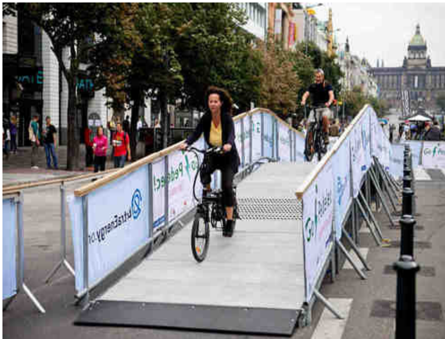
Abb. 1: Go Pedelec! Test Track in Prag, designt und betrieben von ExtraEnergy e. V. Auf dem Track sind im Rahmen des Go Pedelec! Projektes von 2009-2012 mehrere tausend Personen in sechs Ländern Pedelec-probegefahren.

Um 11:00 Uhr hat sich Umweltminister Berlakovich für einen Besuch angesagt.