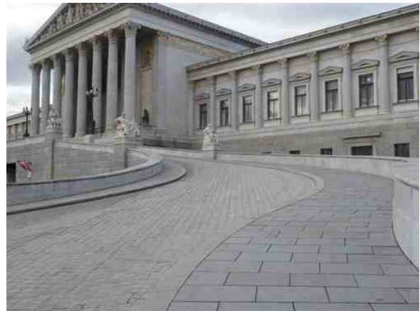
Abb. 3: Rechte Rampe des Wiener Parlaments

In Kooperation mit den Wiener Fahrradhändlern versuchen wir Ihnen eine möglichst große Pedelec-Vielfalt zum Ausprobieren anzubieten. Fahren Sie selbst, bringen sie ihre Freunde, Eltern, Großeltern, Kollegen et cetera.